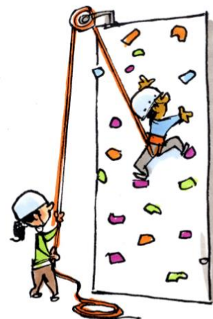
La confiance aux autres

Le rayonnement de l'outil NCF dépasse les frontières du Québec : il est utilisé par des groupes de l'Ontario, du Nouveau-Brunswick, de l'Ouest canadien et de pays comme la France, la Belgique, la Suisse ou la Tunisie.