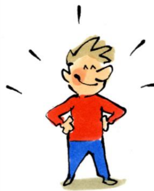
La confiance en soi