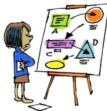
SENS DE L'ORGANISATION

Finalement, la reconnaissance qui prend forme tout au long de ces ateliers revêt un caractère formel pour le groupe de personnes participantes, dans la mesure où elles partagent une manière commune de nommer leurs compétences et de parler de leurs expériences.